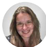
Māra Dāme Lasīt vairāk