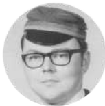
SIKI "LETTONIA" Filistru Palīdzības Biedrība Lasīt vairāk