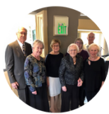
Saginavas Latviešu klubs